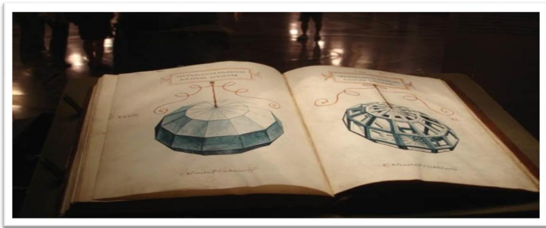
Handrit Da Vinci sem var til sýnis í Galleria Vittorio Emanuele II

Við fengum að fara á nokkurs konar forsyningu á sýningu á teikningum eftir Leonardo Da Vinci sem var opnuð í haust í MUSEO NAZIONALE DELLA SCIENZA E DELLA TECNOLOGIA sýningin á að standa út árið 2015 í tilefni af EXPÓ sýningunni í Mílanó það ár.