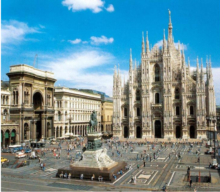
Duomo kirkjan og Galleria Vittorio Emanuele II

Á þriðjudagskvöldinu var svo eina skemmtikvöld ráðstefnunnar.