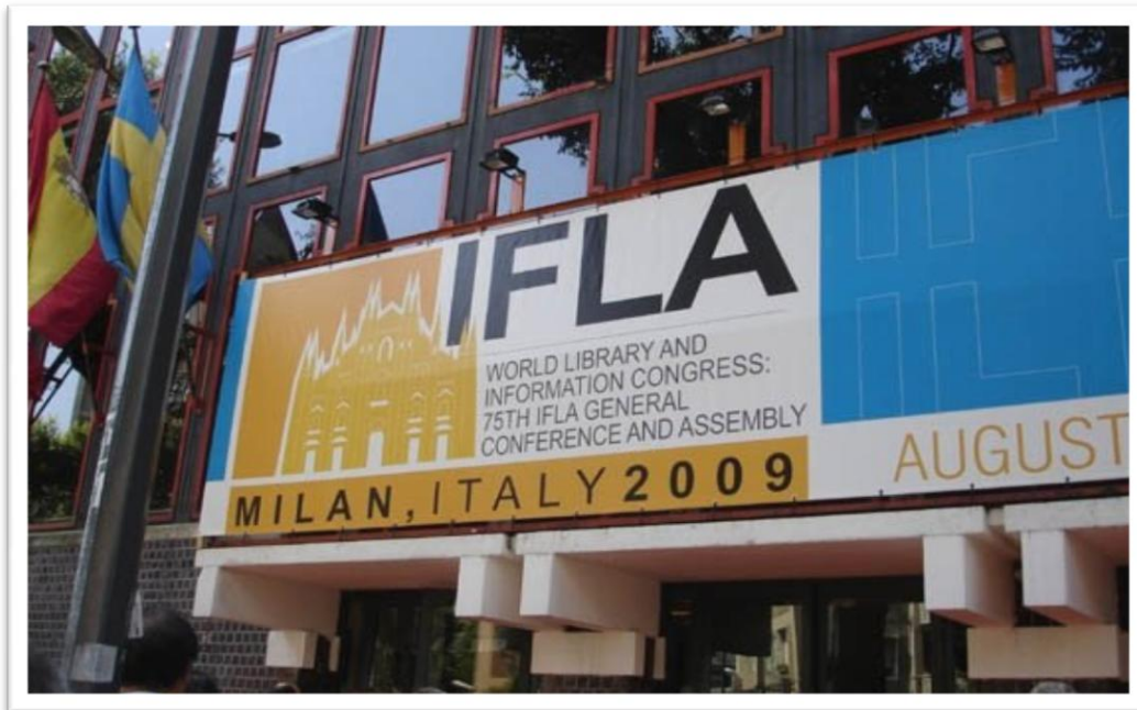
Fyrir framan ráðstefnuhöllina í Mílanó

IFLA er alþjóðlegt samband bókasafna og stofnana og var stofnuð í Edinborg, árið 1927. Árið 2002 var haldið uppá 75 ára afmæli IFLA á árlegu ráðstefnunni í Glasgow. Í dag eru 1600 meðlimir í IFLA í um það bil 150 löndum um allan heim. Höfuðstöðvar IFLA eru í Haag The Royal Library, the national library of the Netherlands . Hjá IFLA eru átta yfirdeildir sem eru flokkaðar eftir tegundum safna, þannig að á ráðstefnunni á að vera eitthvað sem höfðar til flestra safnategunda.